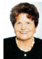
Štěpánka Kudělková Controlling s.r.o. Valašské Meziříčí