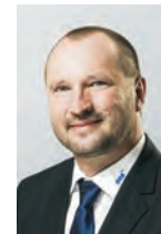
Jakub Unucka náměstek hejtmána Moravskoslezského kraje