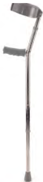
123 EX 12/0023698