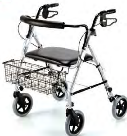
249 A 12/0023777