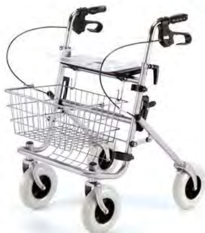
100 WHD 12/0023735