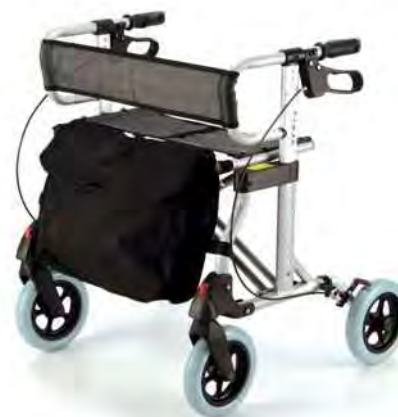
105 B 12/0140089